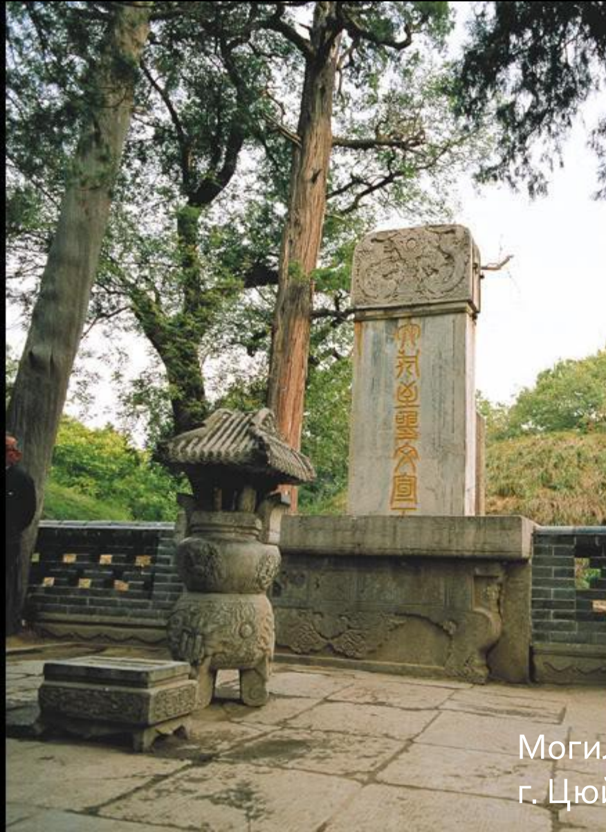
Могила Конфуция в г. Цюйфу