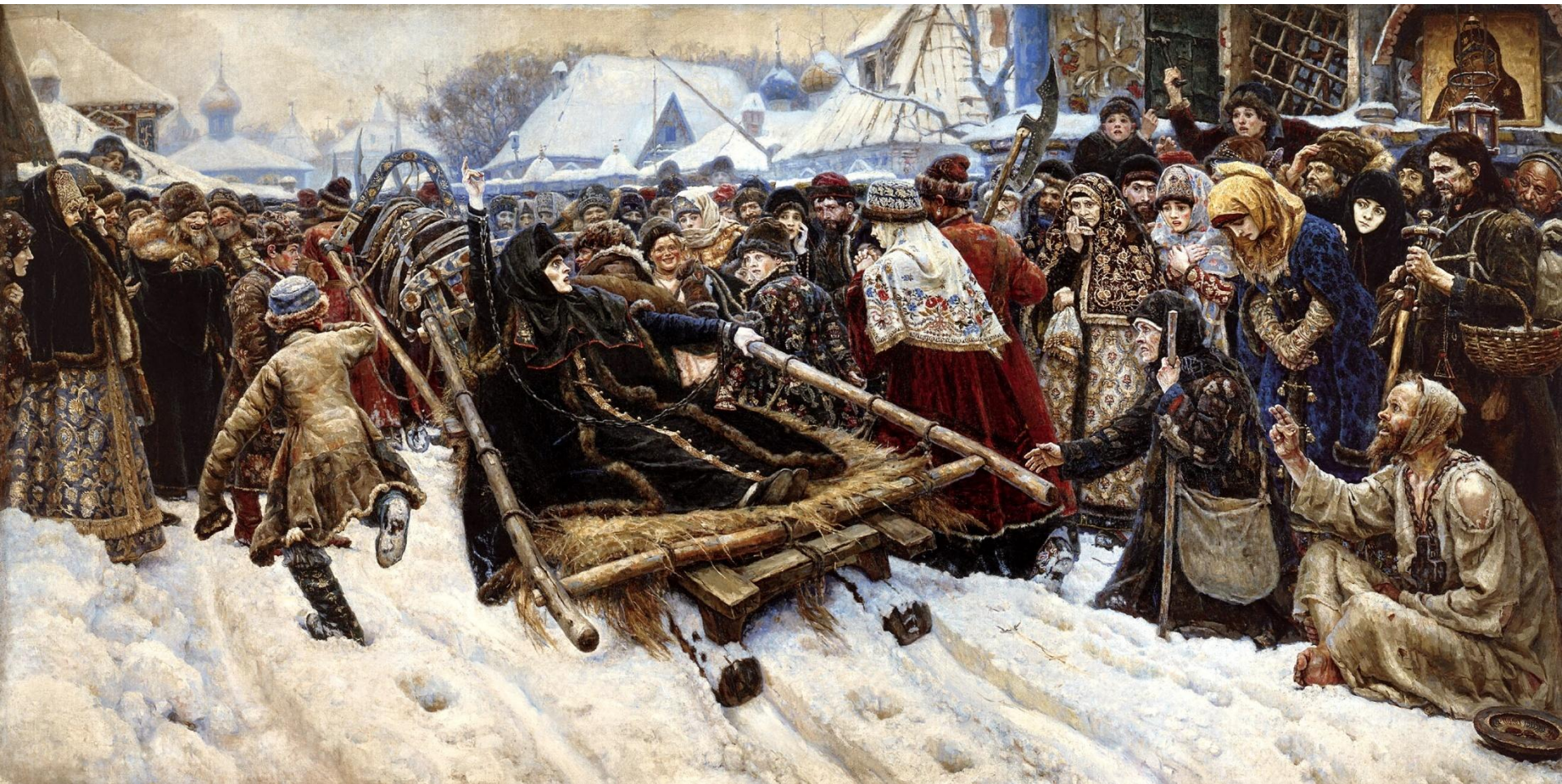
▣ Суриков В. «Боярыня Морозова»