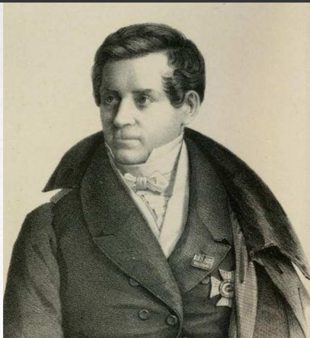
Август Шлегель (1767–1845)