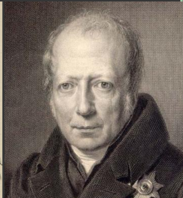
Вильгельм фон Гумбольдт (1767–1835)