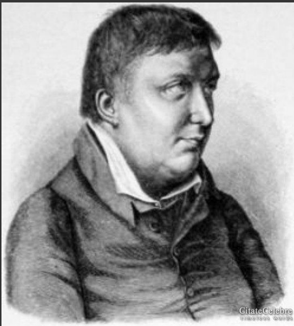
Фридрих Шлегель (1772–1829)