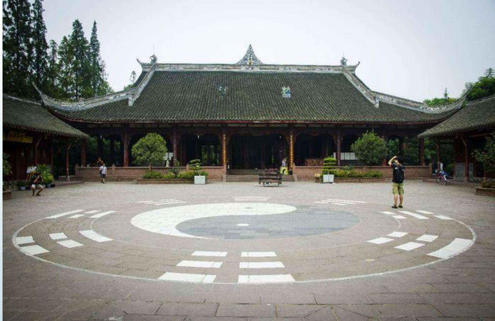
Дворик с одним из главных символов Даосизма – баланс между инь и ян.