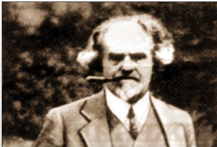
Николай Бердяев (1874-1948)

Лишь личность может нам объяснить, что есть человек, а не наоборот. Особенно же есть абсолютная, то есть божественная духовная единица, а потому она в исходном своем качестве возникает как абсолютная свобода, то есть свобода прочь от всего, в том числе и от Бога, потому что и в отношении к Богу личность имеет возможность определиться сама.