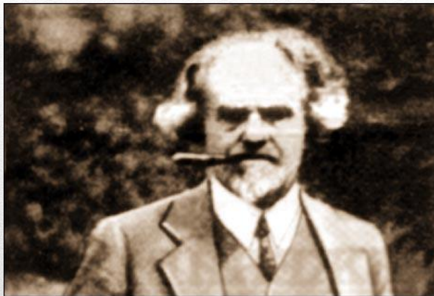
Николай Бердяев (1874-1948)

Лишь личность может нам объяснить, что есть человек, а не наоборот. Особенно же есть абсолютная, то есть божественная духовная единица, а потому она в исходном своем качестве возникает как абсолютная свобода, то есть свобода прочь от всего, в том числе и от Бога, потому что и в отношении к Богу личность имеет возможность определиться сама.