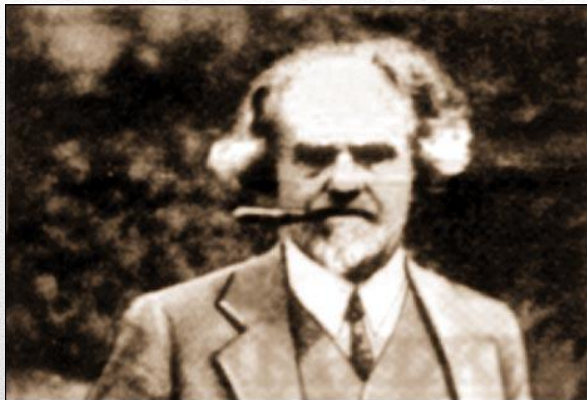
Николай Бердяев (1874-1948)

Лишь личность может нам объяснить, что есть человек, а не наоборот. Особенно же есть абсолютная, то есть божественная духовная единица, а потому она в исходном своем качестве возникает как абсолютная свобода, то есть свобода прочь от всего, в том числе и от Бога, потому что и в отношении к Богу личность имеет возможность определиться сама.