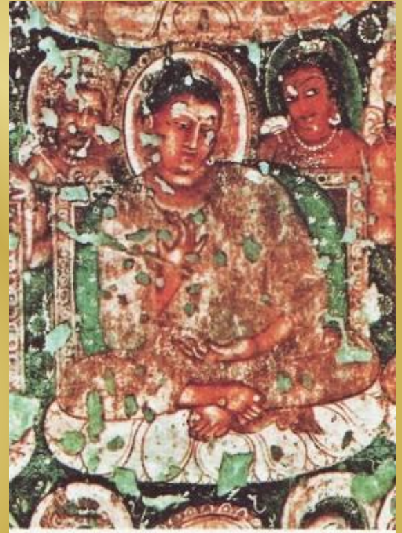
Будда, сидящий на лотосовом троне. VI—VII вв.