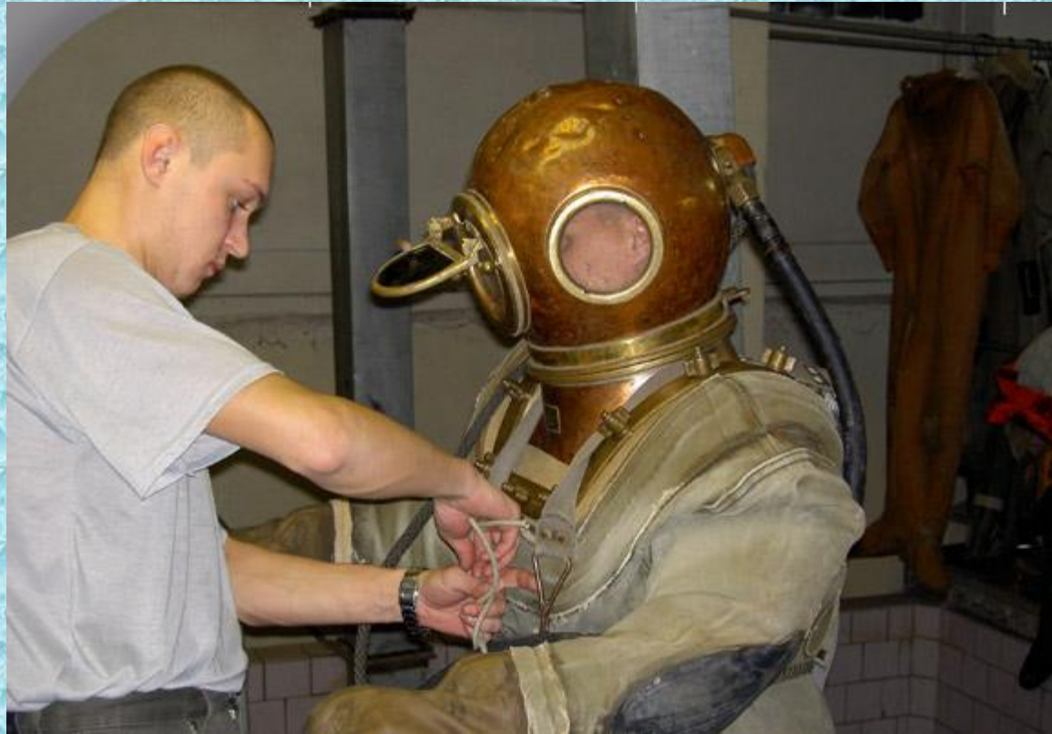
Одевание водолазного скафандра

Изготовлен из резины, шлем сделан из металла. Не изолирует водолаза от воздействия давления внешней среды (воды). Самым простым примером мягкого водолазного скафандра может служить трехболтовое водолазное