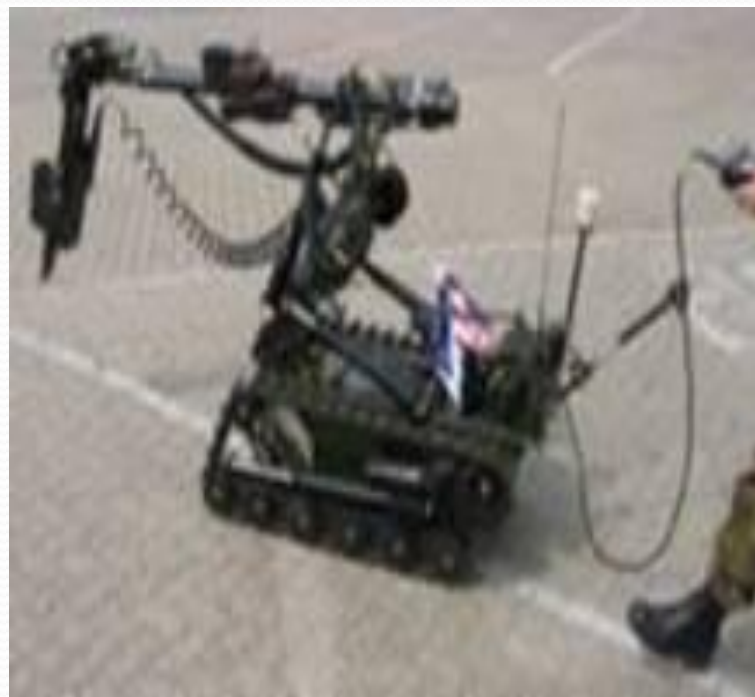
Робот-сапер на гусеничном ходу