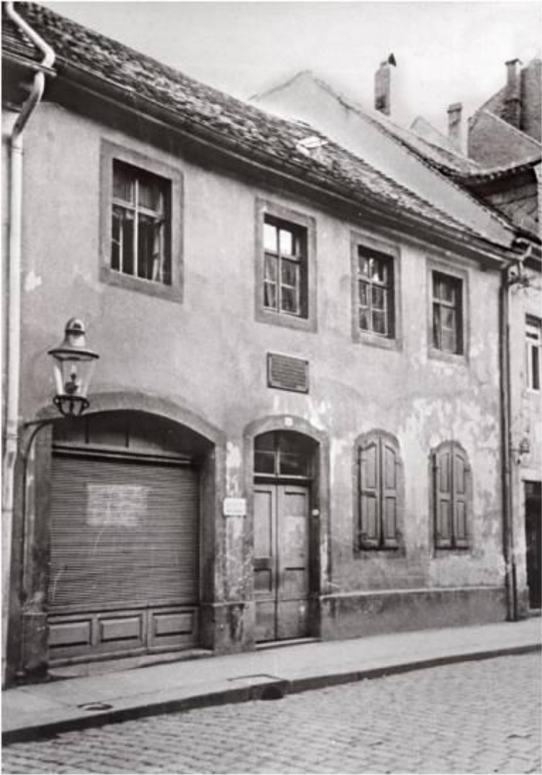
Вид дома, где в 1739-1740 гг. жил М.В. Ломоносов. Саксония, г. Фрейберг. 1950-е.