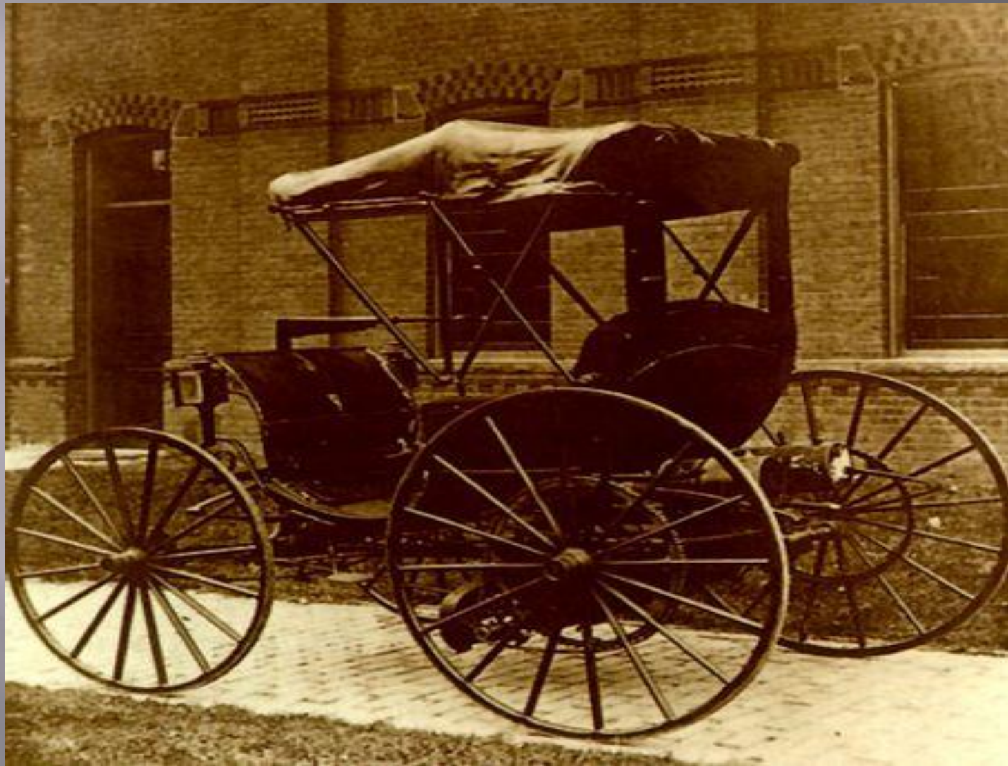
□ Автомобиль Даймлера