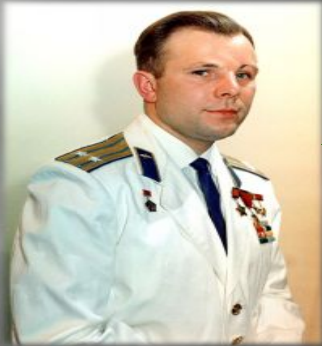
Юрий Алексеев ич Гагарин