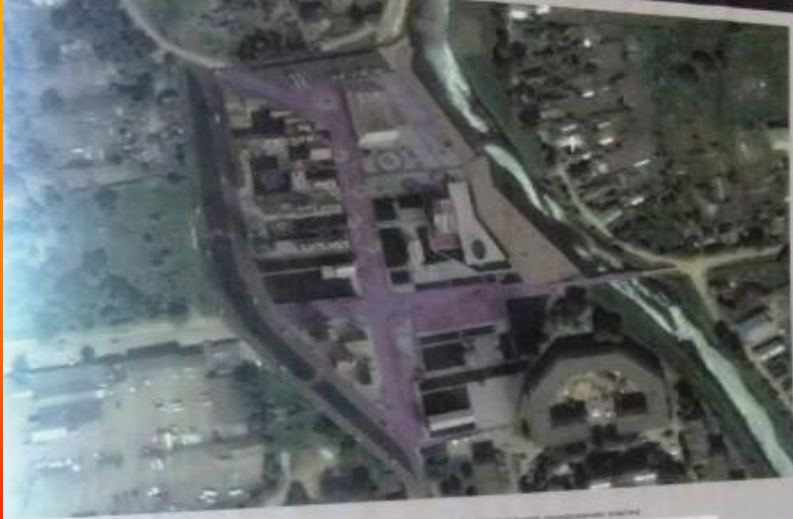
Смодельный парк по концепции Планировочный участок за территорией ГЭС Конфигурация участка

Концепция развития Мемориального музея Ю.А.Гагарина по адресу: Смоленская область, г. Гагарин, ул. Гагарина 74