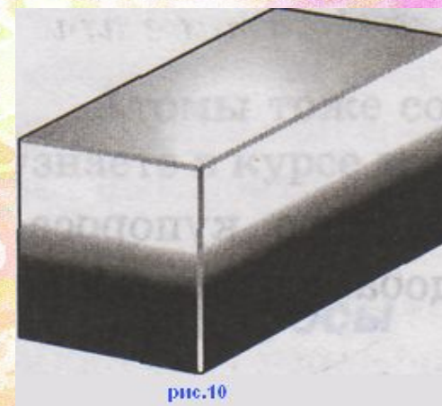
В ТВЕРДЫХ ТЕЛАХ