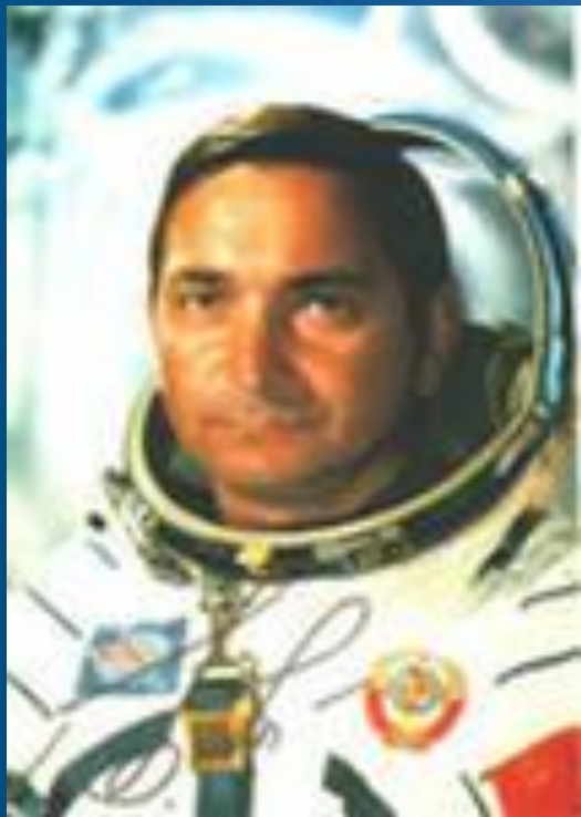
Летчик-космонавт Валерий Быковский