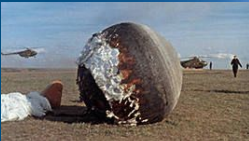
Поисковая группа обнаружила спускаемый аппарат В.В. Терешковой