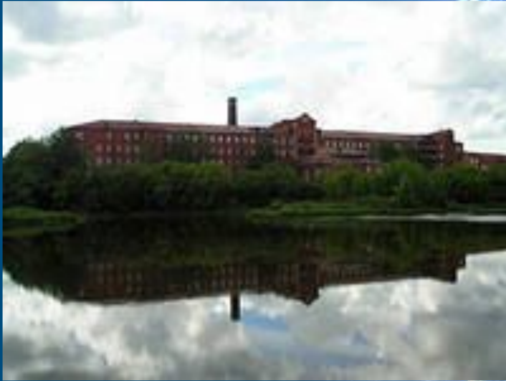
Ярославский комбинат технических тканей «Красный перекоп»