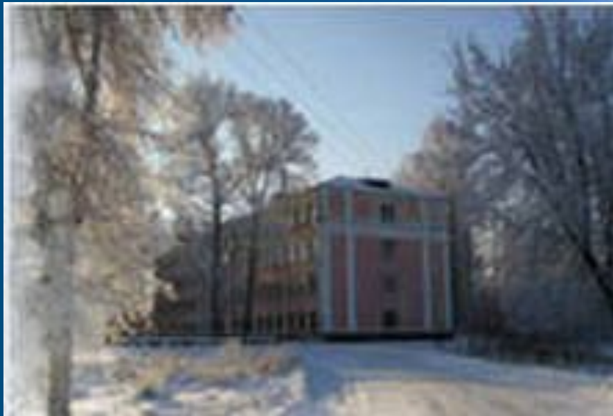
Средняя школа №32 города Ярославля имени В.В. Терешковой