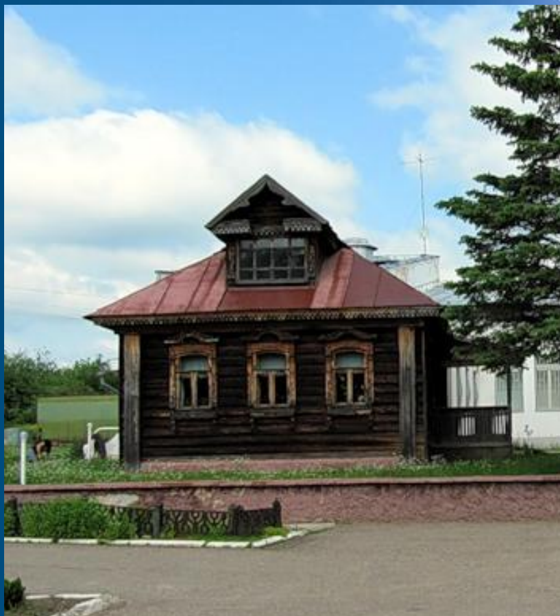
Дом Терешковых в музее «Космос»