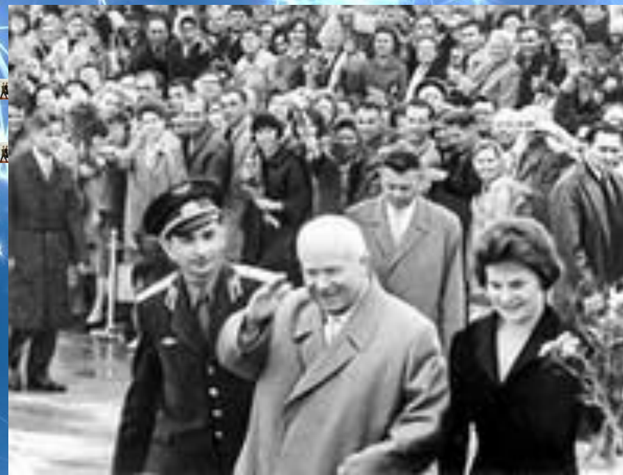
Встреча Терешковой и Быковского