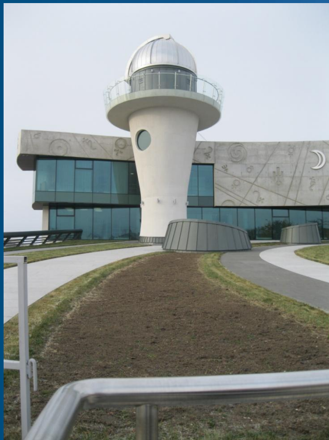
Просветительский центр г. Ярославль