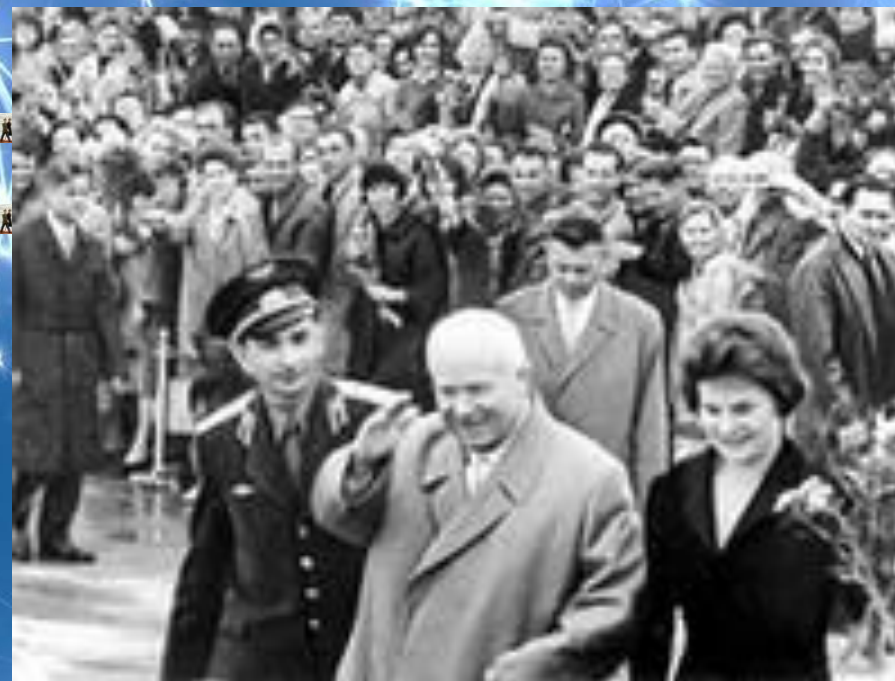
Встреча Терешковой и Быковского