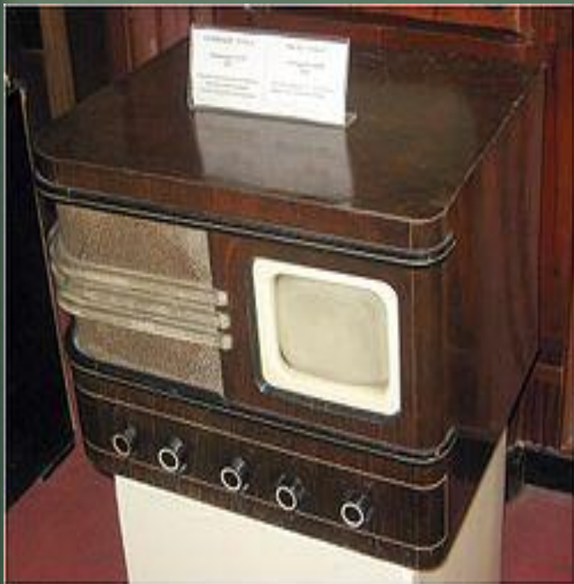
Телевизор «17ТН – 1/3», СССР, 1939 год

Греческое слово «теле» означает «вдаль», «далеко», а латинское слово «визор» переводится как «смотрящий». Вместе они образовали знакомое нам слово «телевизор». Телевизор – это радиоприёмник, но только более сложный. Он принимает и передает не только звук, но и картинку.