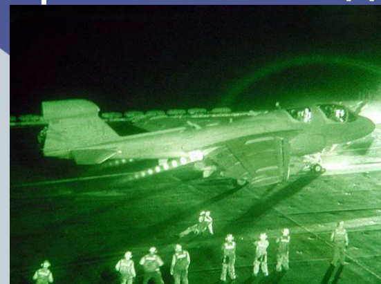
Вид в приборе ночного видения