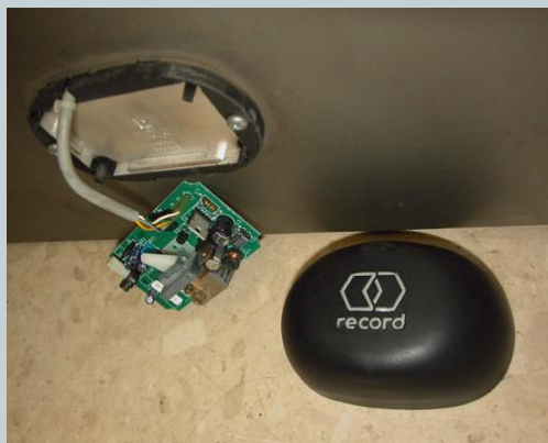
Инфракрасный датчик для дверей