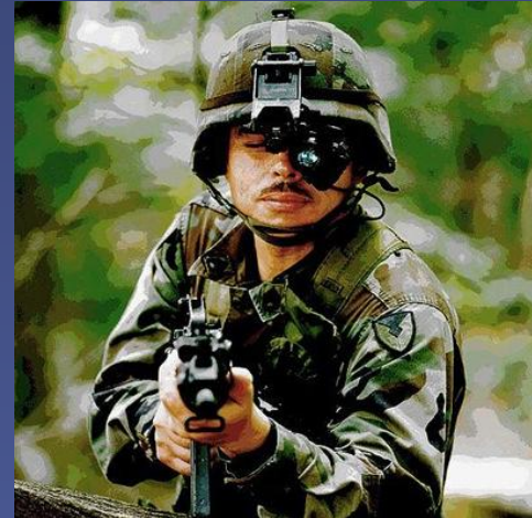
Прибор ночного видения