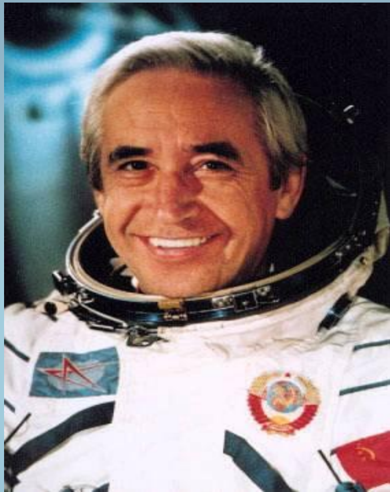
ФЕОКТИСТОВ Константин Петрович