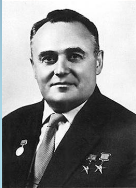
КОРОЛЕВ СЕРГЕЙ ПАВЛОВИЧ