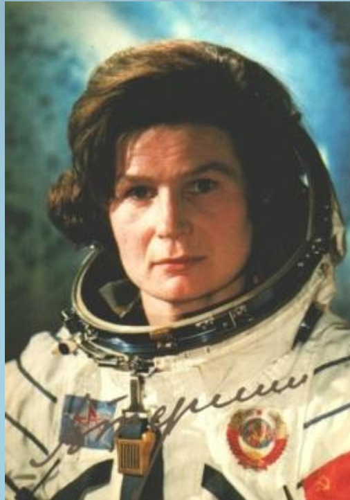
Валентина Владимировна Николаева-Терешкова. Первая в мире женщина-космонавт.