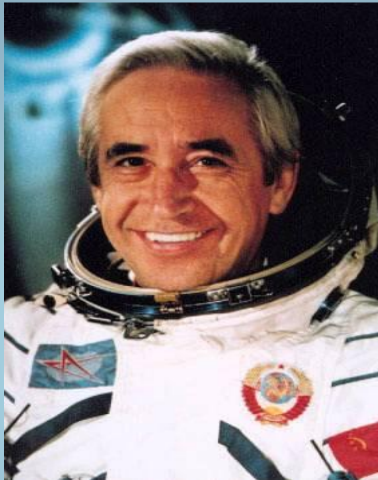
ФЕОКТИСТОВ Константин Петрович