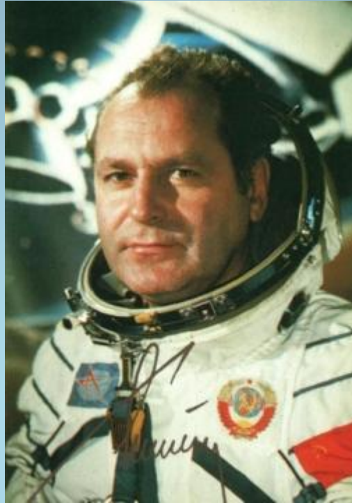
Герман Степанович Титов.