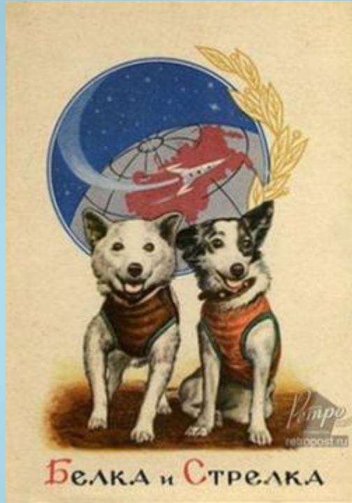
БЕЛКА и СТРЕЛКА