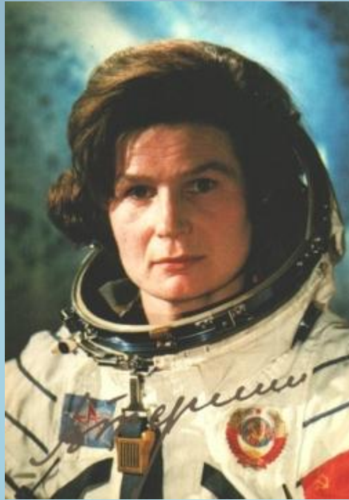
Валентина Владимировна Николаева-Терешкова. Первая в мире женщина-космонавт.