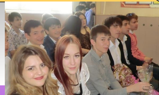
СОВМЕСТНЫЕ МЕРПОРЯТИЯ И ПРАЗДНИКИ С КЛАССОМ