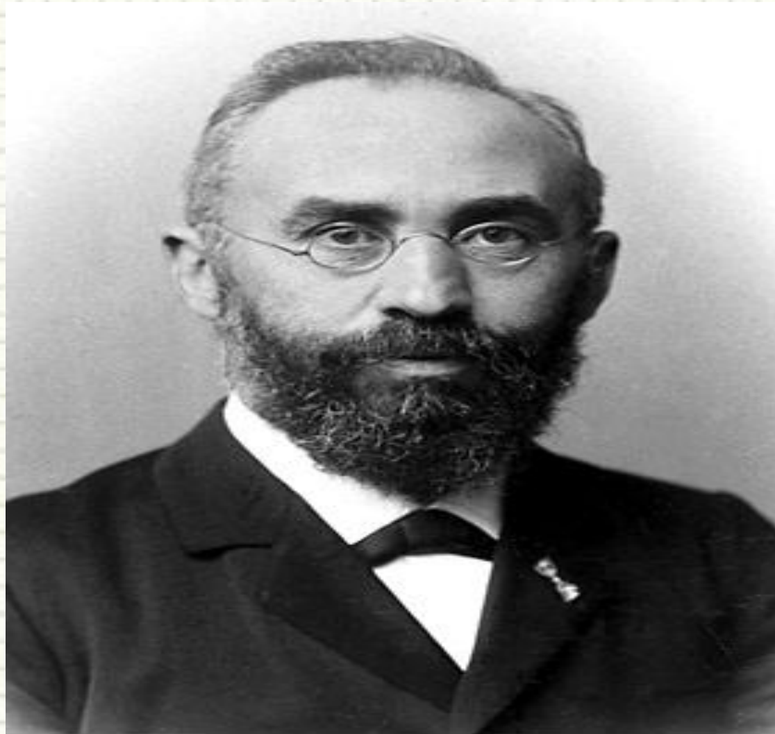
Хендрик Антон Лоренц голланд физигі 1853-1928