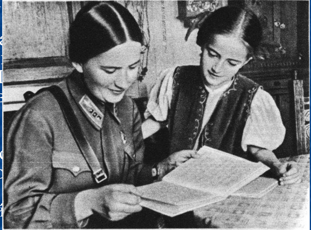
Марина Раскова с дочерью