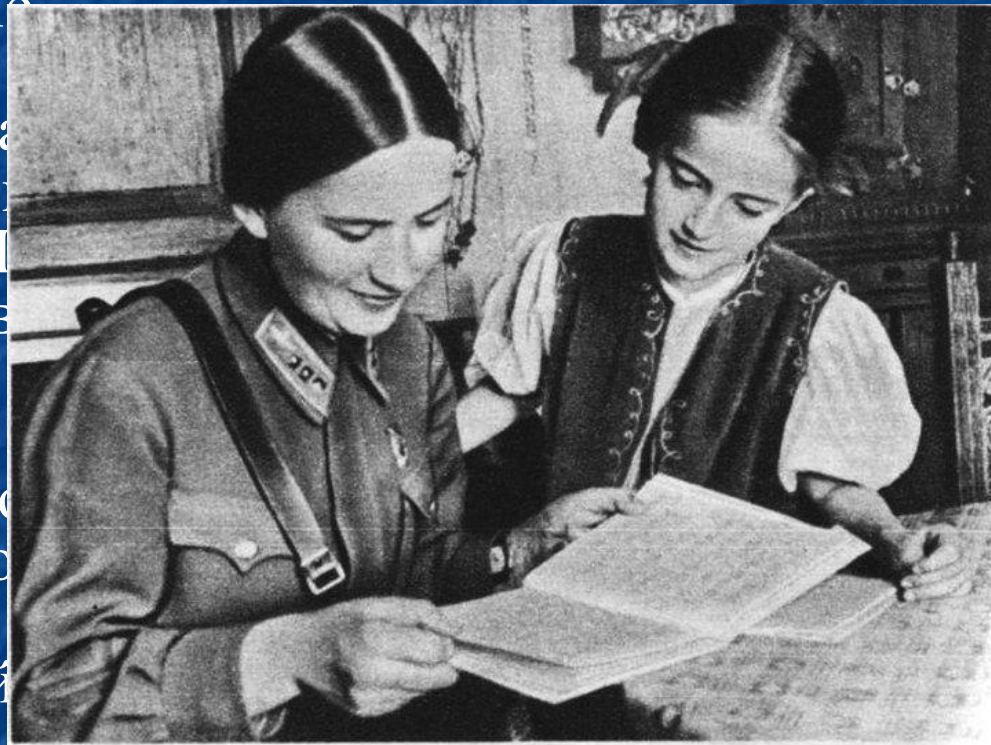
Марина Раскова с дочерью