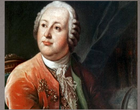
М. В. ЛОМОНОСОВ