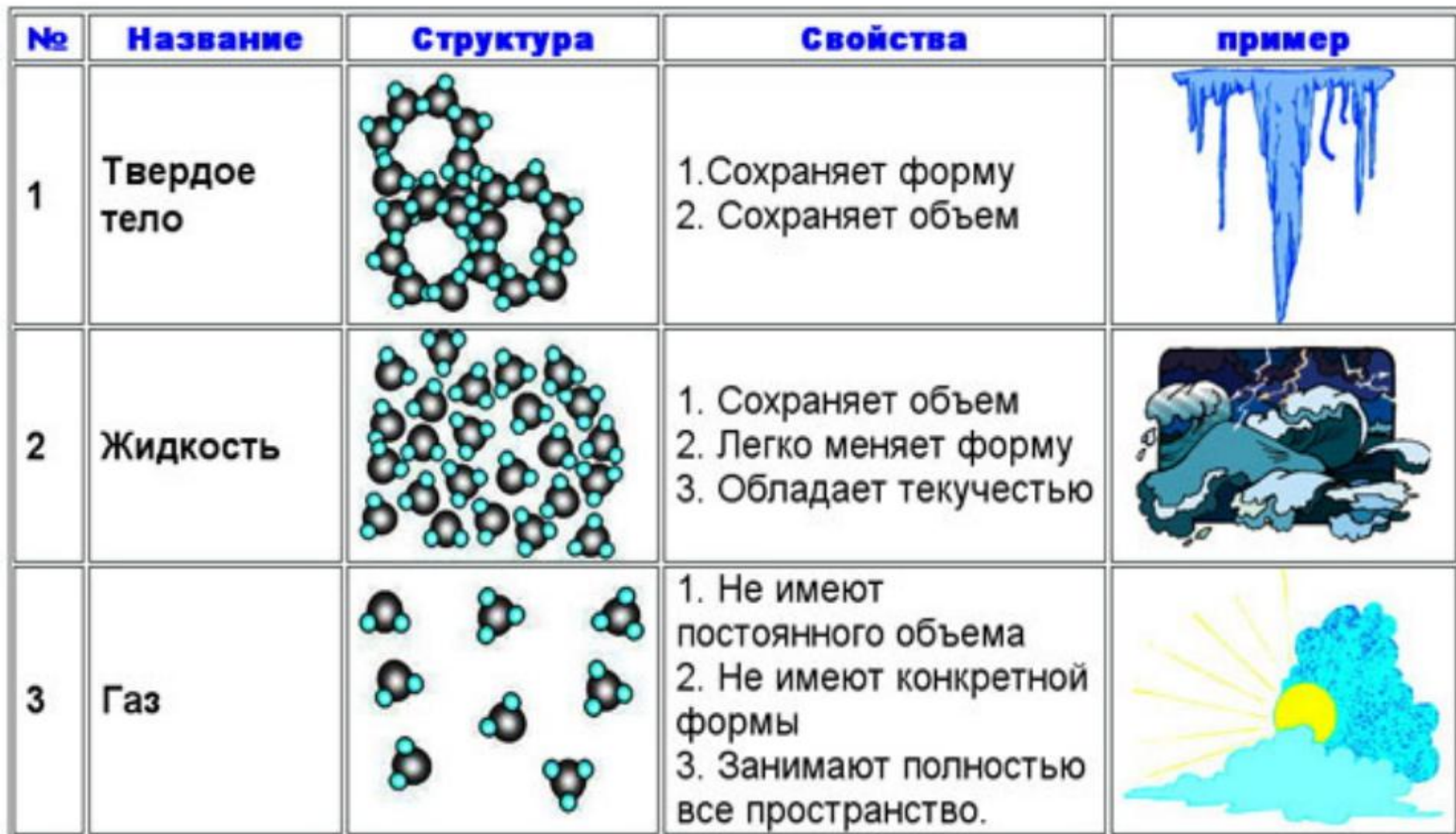
ТАБЛИЦА АГРЕГАТНЫХ СОСТОЯНИЙ ВЕЩЕСТВА