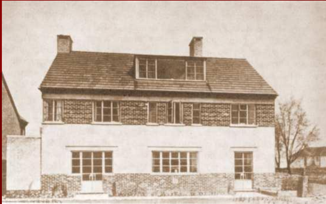
Дом П.Л. Капицы в Кембридже. В 1970 г. он был подарен им Академии наук СССР