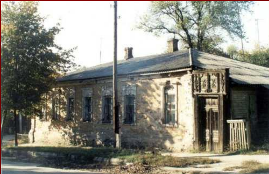
Дом семьи Иоффе в г. Ромны.