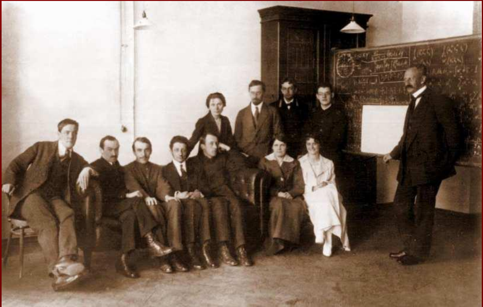
Семинар Иоффе в Политехническом институте. 1916 г.