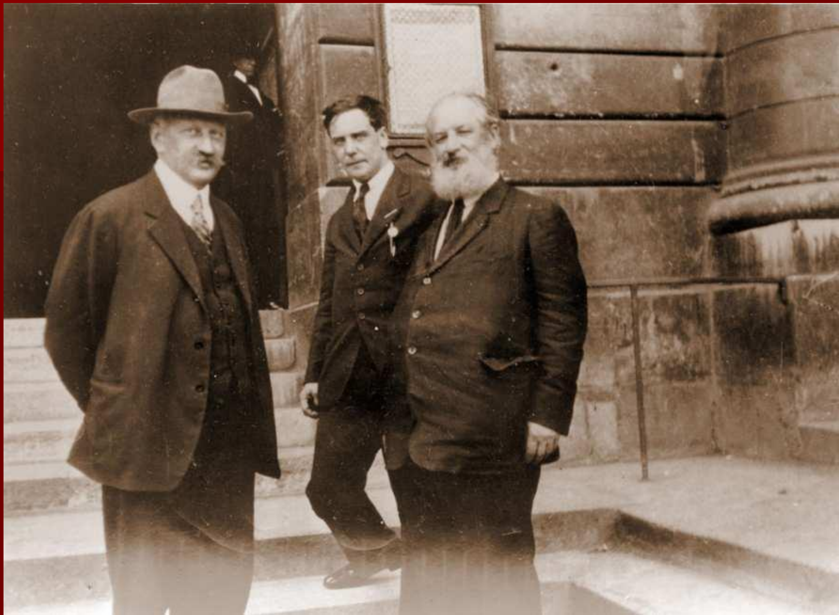
Иоффе, Капица, Крылов. Лейден, 1924