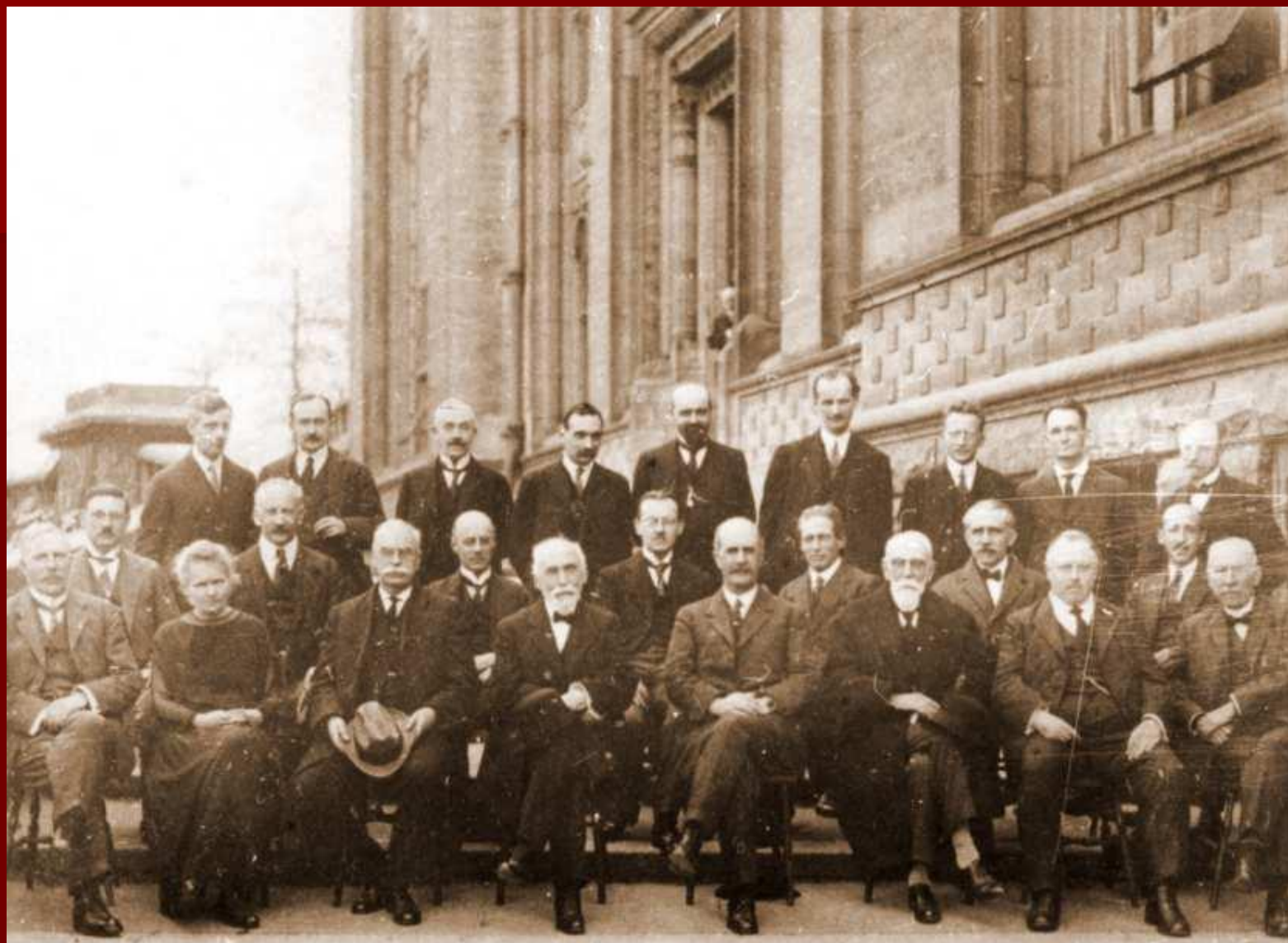
Иоффе на Сольвеевском конгрессе. 1924 г