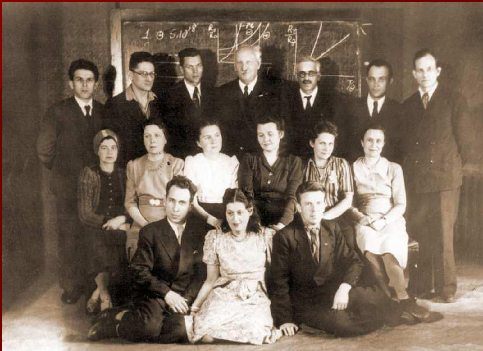
Иоффе с сотрудниками. 1930-е гг. Среди них: Ю. Дунаев, Б. Курчатов, В. Жузе, Б. Коломиец и А. Регель.