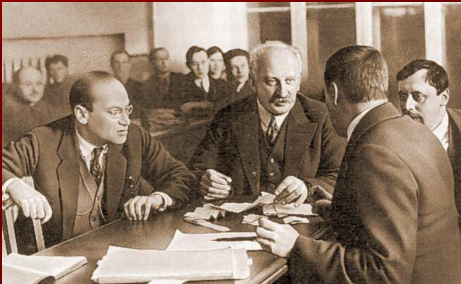
Заседание Ученого совета ФТИ. Френкель, Иоффе, Бурсиан (спиной) — ученый секретарь, Добронравов. Конец 20-х гг.