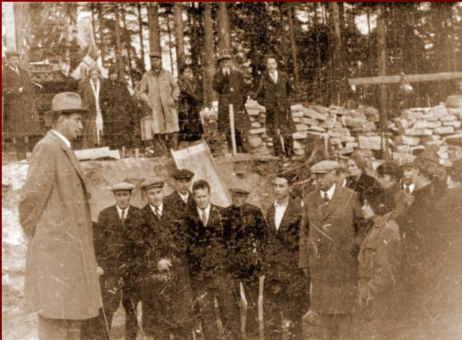
Иоффе на строительстве циклотрона ФТИ. Крайний слева на переднем плане — Курчатов.