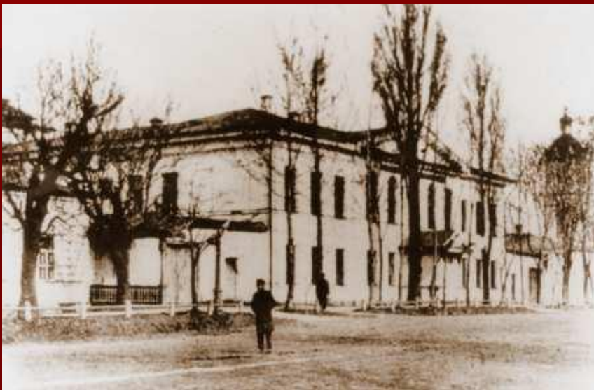
Роменское реальное училище.