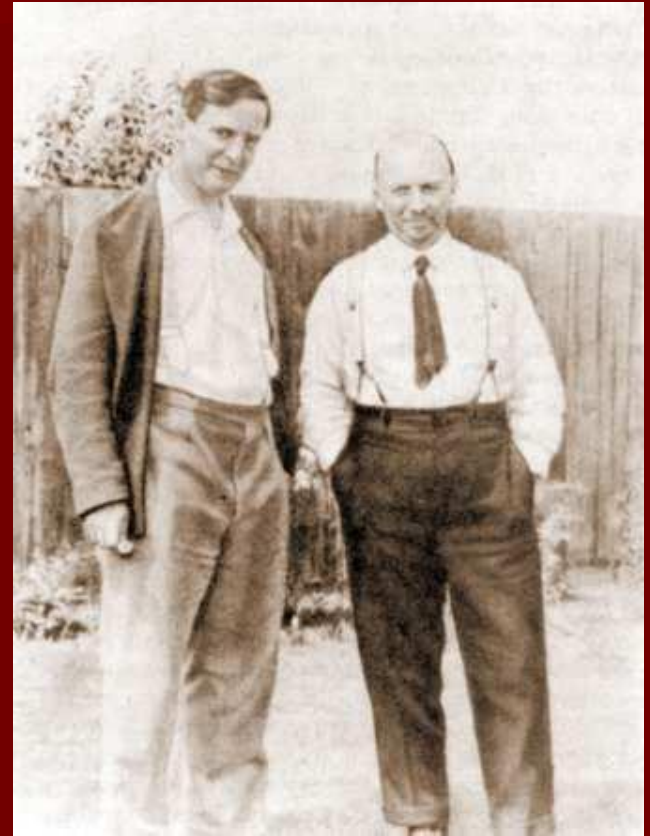
П.Л. Капица и Н.И. Бухарин во дворе кембриджского дома Капицы. Июль 1931 г.