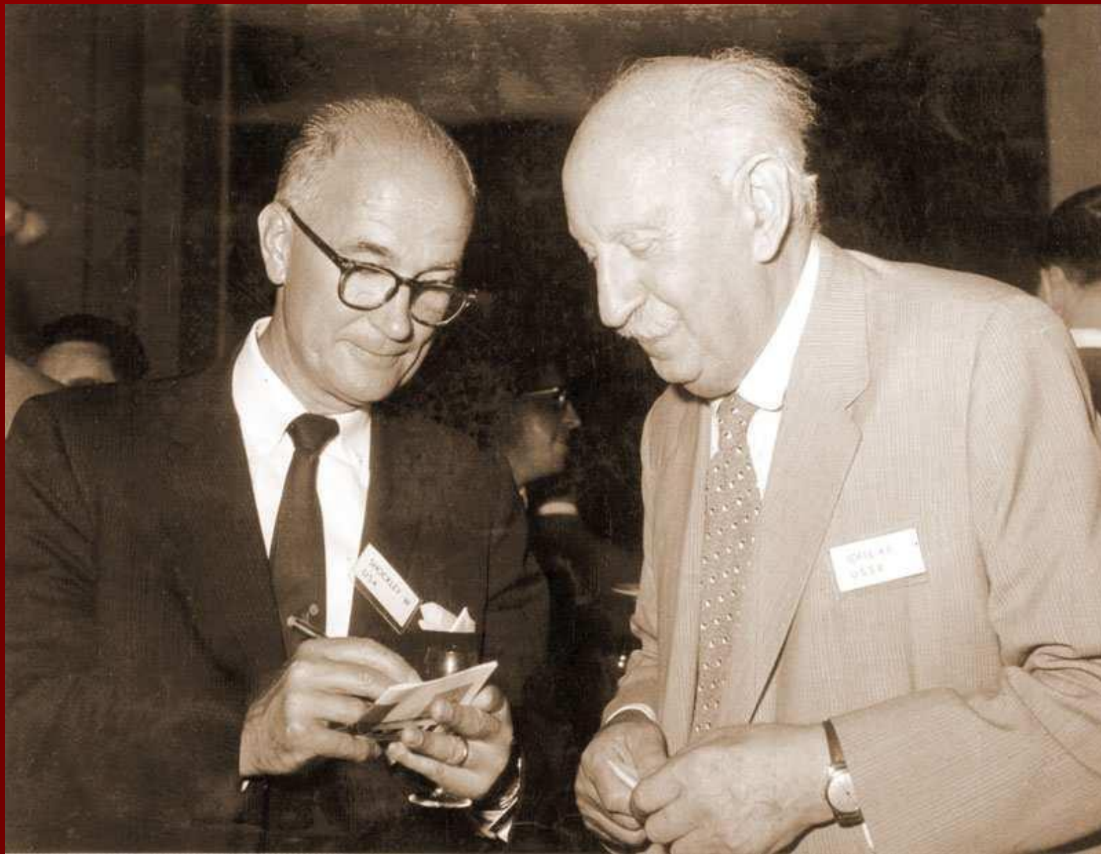
В. Шокли и Иоффе. Прага. 1960.