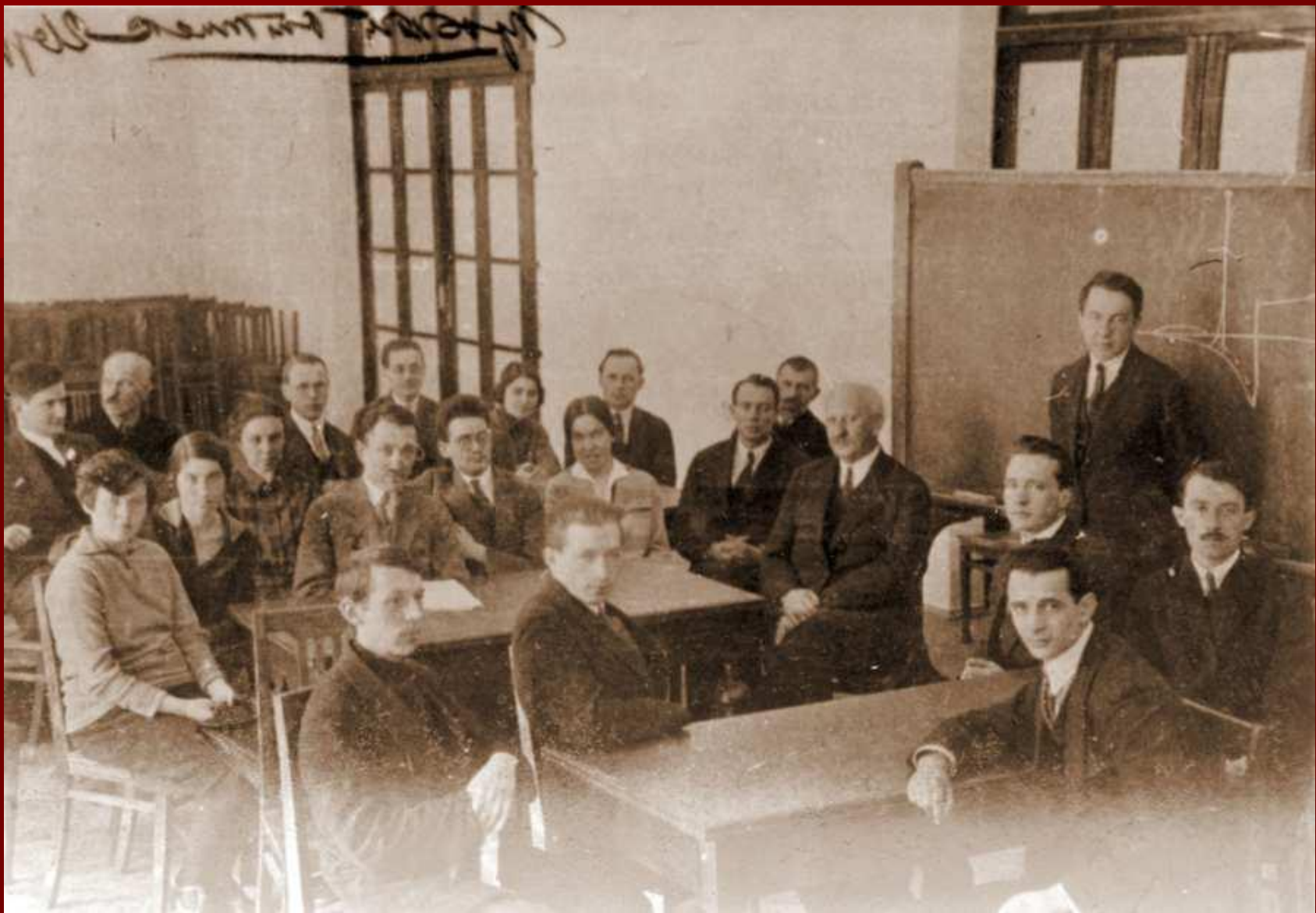
Иоффе, на семинаре по физике полупроводников. Крайний слева — И. Курчатov, рядом с Иоффе сидит Кобеко, крайний правый Г. Гринберг, у доски — Цехновицер.