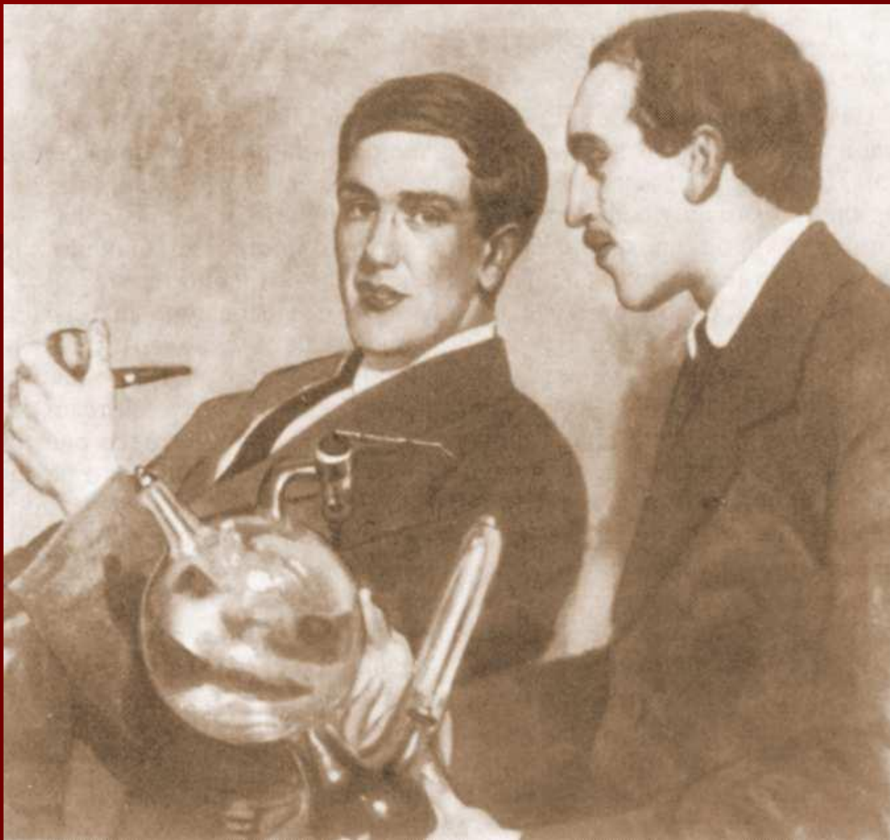
Б.М. Кустодиев. Портрет П.Л. Капицы и Н.Н. Семенова. Х., м. 71 x 71. 1921 г.