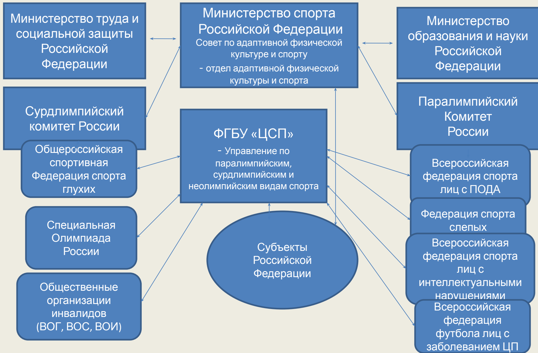
Структура управления адаптивной физической культурой и спортом в Российской Федерации