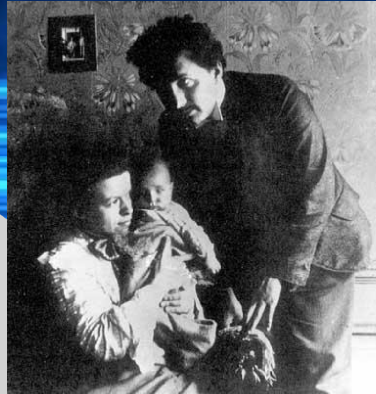
Новорожденный Ганс-Альберт с родителями, 1904.

❖ После окончания Политехникума в 1900 году, молодой дипломированный преподаватель физики (Эйнштейну шел тогда двадцать второй год) жил в основном у родителей в Милане и два года не мог найти постоянной работы. Только в 1902 он получил место эксперта в федеральном Бюро патентов в Берне. Незадолго до этого Альберт сменил гражданство и стал швейцарским подданным. Через несколько месяцев после устройства на работу он женился на своей бывшей цюрихской однокурснице Милеве Марич.