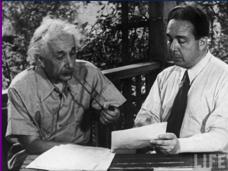
Альберт Эйнштейн и Лео Силард

В августе 1939 года Эйнштейн поставил свою подпись под письмом, написанным по инициативе физика-эмигранта из Венгрии Лео Силарда на имя президента США Франклина Делано Рузвельта. В письме обращалось внимание президента на возможность того, что нацистская Германия обзаведется атомной бомбой. После нескольких месяцев размышлений Рузвельт решил серьезно отнестись к этой угрозе и открыл собственный проект по созданию атомного оружия.