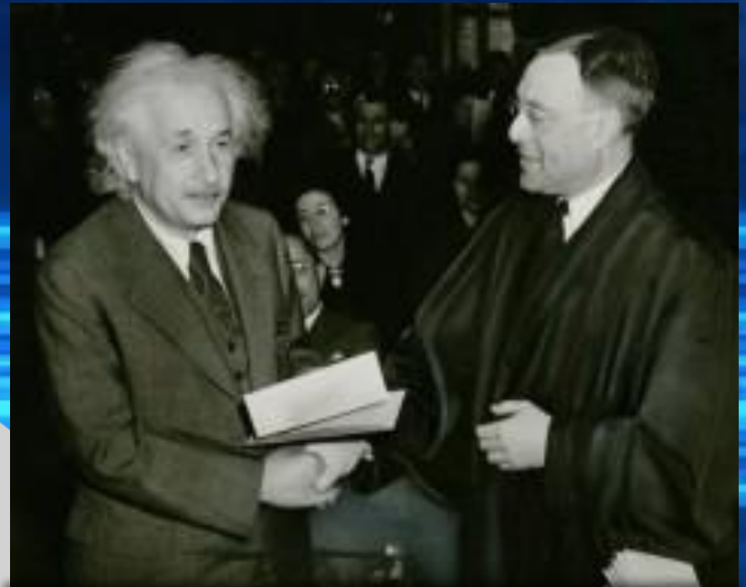
Эйнштейн получает сертификат об американском гражданстве (1940)

Когда в Германии к власти пришли нацисты, Эйнштейн вынужден был уехать из Германии - как оказалось, навсегда. В 1933 г. он отказался от гражданства, вышел из состава Баварской и Прусской академий наук и эмигрировал в США. Там ему оказали весьма теплый прием, поддержали репутацию величайшего ученого и предоставили должность в Принстонском институте перспективных исследований. Будучи человеком науки, он не отрывался от общественно-политической жизни, активно выступал против военных действий, ратовал за уважение прав человека, гуманизм.