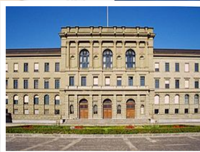
Швейцарская высшая техническая школа Цюриха (ETHZ)