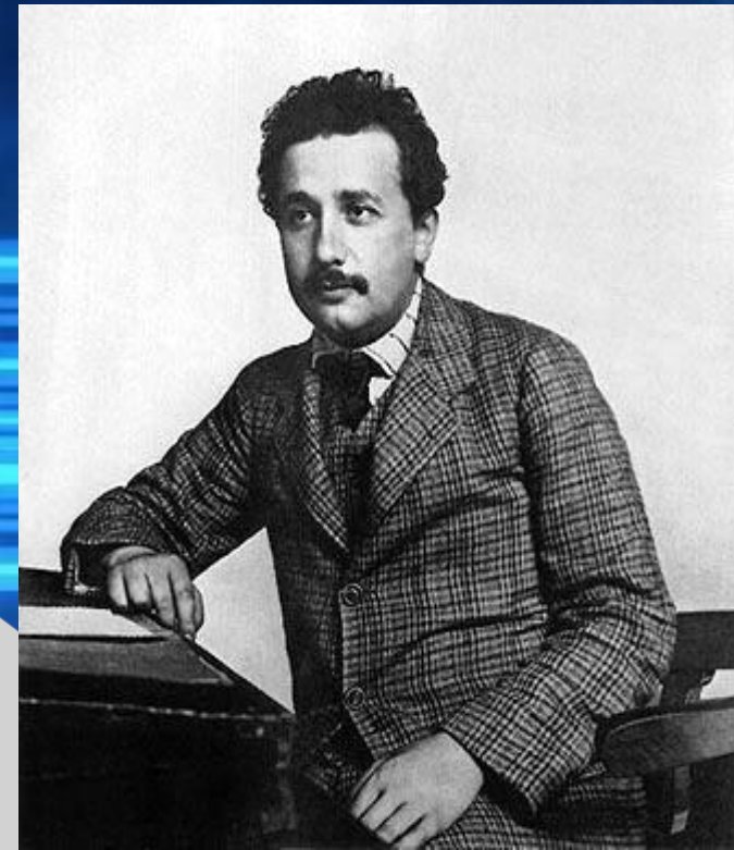
Эйнштейн на своем рабочем месте в Бернском патентном бюро. Фото сделано в год выхода знаменитой статьи «К электродинамике движущихся тел».

В Бюро патентов, которое Эйнштейн называл «светским монастырем», он проработал семь с лишним лет, считая эти годы самыми счастливыми в жизни. Должность «патентного служки» постоянно занимала его ум различными научными и техническими вопросами, но оставляла достаточно времени для самостоятельной творческой работы. Ее результаты к середине «счастливых бернских лет» составили содержание научных статей, которые изменили облик современной физики, принесли Эйнштейну мировую славу.