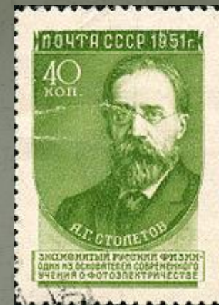
Почтовая марка СССР, 1951 год