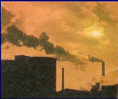
Забруднення навколишнього середовища