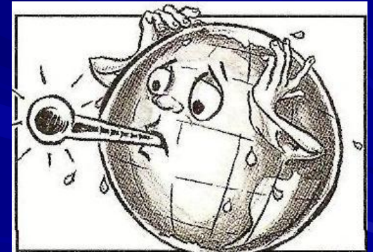
Підвищення температури на планеті