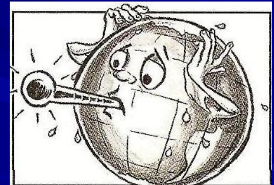
Підвищення температури на планеті