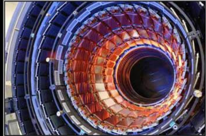
LARGE HADRON COLLIDER

Большой адронный коллайдер на встречных пучках, предназначенный для разгона протонов и тяжёлых ионов и изучения продуктов их соударений. Коллайдер построен в научно-исследовательском центре Европейского совета ядерных исследований, на границе Швейцарии и Франции, недалеко от Женевы. По состоянию на 2008 год БАК является самой крупной экспериментальной установкой в мире. Большим БАК назван из-за своих размеров: длина основного кольца ускорителя составляет 26 659 адронным — из-за того, что он ускоряет адроны, то есть частицы, состоящие из кварков; коллайдером — из-за того, что пучки частиц ускоряются в противоположных направлениях и сталкиваются в специальных местах