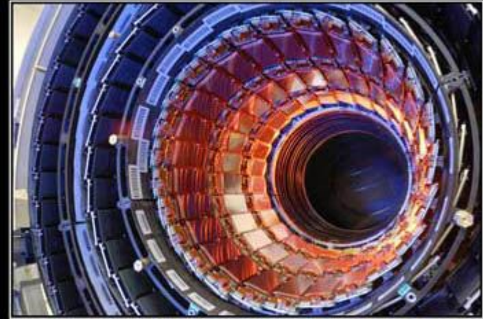
LARGE HADRON COLLIDER

Большой адронный коллайдер на встречных пучках, предназначенный для разгона протонов и тяжёлых ионов и изучения продуктов их соударений. Коллайдер построен в научно-исследовательском центре Европейского совета ядерных исследований, на границе Швейцарии и Франции, недалеко от Женевы. По состоянию на 2008 год БАК является самой крупной экспериментальной установкой в мире. Большим БАК назван из-за своих размеров: длина основного кольца ускорителя составляет 26 659 метров — из-за того, что он ускоряет адроны, то есть частицы, состоящие из кварков; коллайдером — из-за того, что пучки частиц ускоряются в противоположных направлениях и сталкиваются в специальных местах