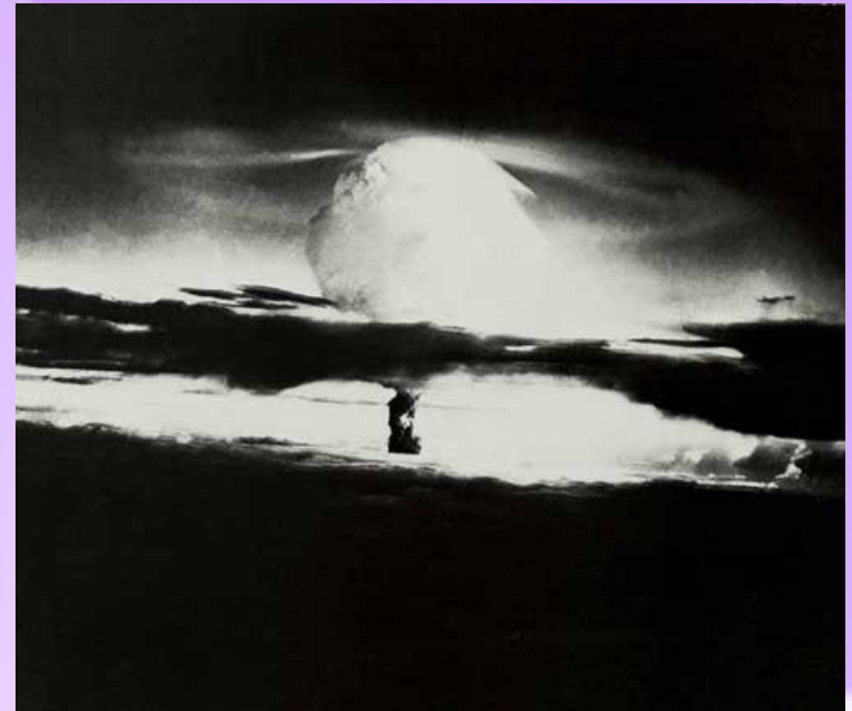
Взрыв атомной бомбы