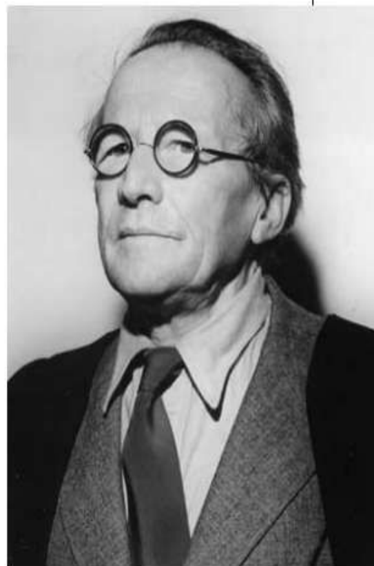
ШРЁДИНГЕР, ЭРВИН австрийский физик. Нобелевская премия по физике 1933 (с П.Дираком ).

\Psi(x, y, z, t) — волновая функция частицы.