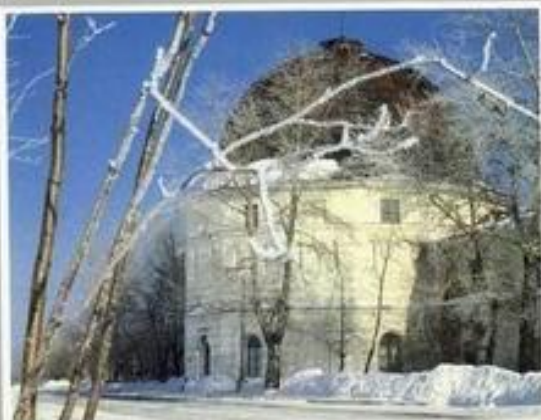
Гостиный двор Архангельска. Современный вид