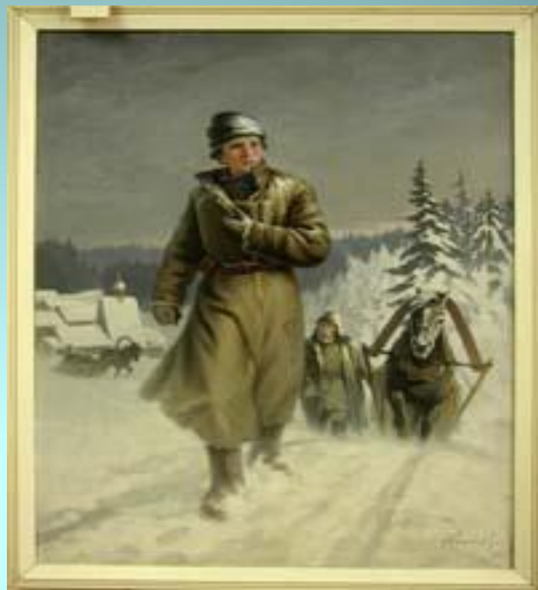
Н.И. Кисляков «Юноша Ломоносов на пути в Москву»