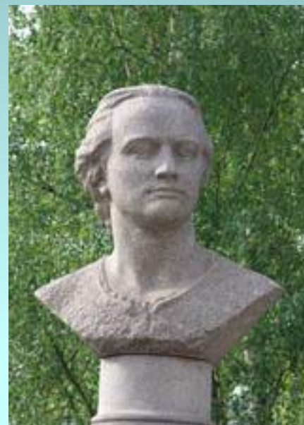
Пам'ятник Ломоносову в г. Архангельське у ПГУ ім М.В.Ломоносова