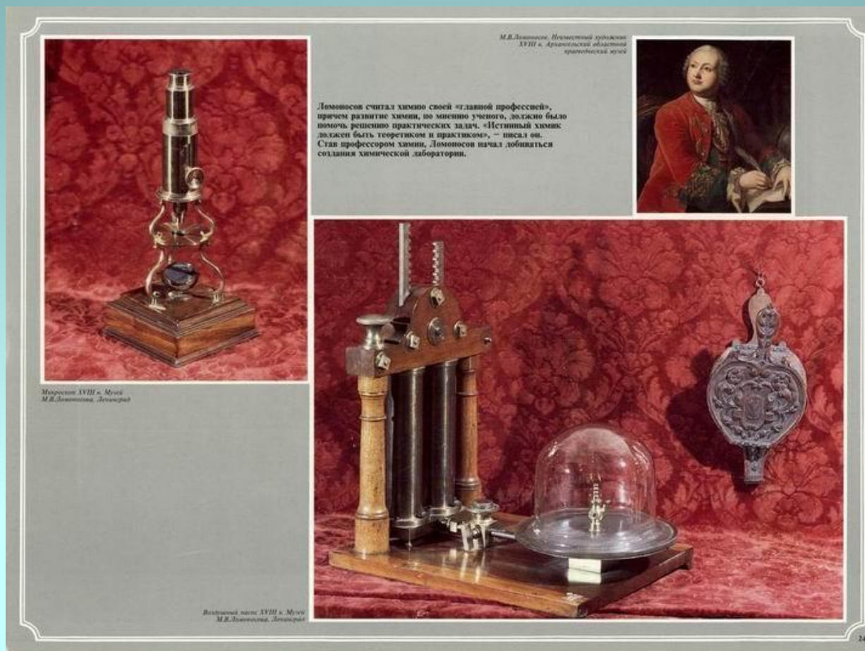
Вещи из химической лаборатории М.В.Ломоносова