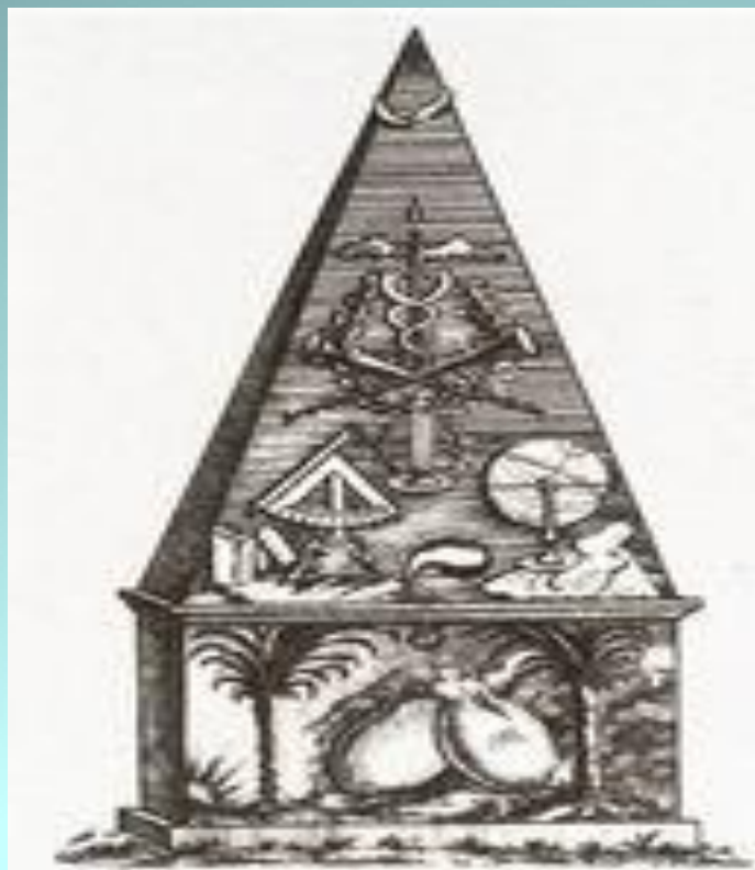
Памятник М. В. Ломоносову установленный на его родине П. И. Челищевым