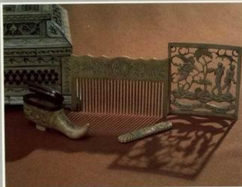
Резьба кости. Телес и граблики для детей. Музей М.В.Ломоносова. Ленинград