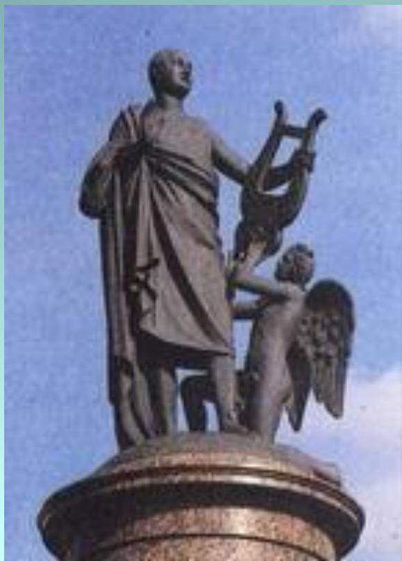
Пам'ятник Ломоносову в г. Архангельське