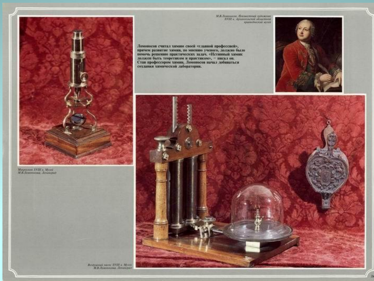
Вещи из химической лаборатории М.В.Ломоносова