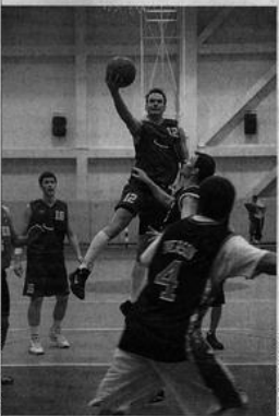
В ИГРЕ ФИНАЛИСТЫ: литовская команда атакует (слева), баскетболисты Лиги журналистов защищаются