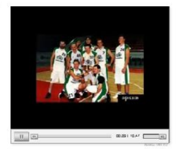
Фоторепортаж с «КУБОКА НАДЕЖДЫ - 2007».

Тринадцатый – счастливый Кубок Надежды Несмотря на повсеместное убеждение, что 13 – число несчастливое организаторы «КУБОКА НАДЕЖДЫ» отказались от идеи проведения очередного состязания мастеров пера и микрофона отказаться не могли. С 95 года десятки журналистов принимают участие в этой акции корпоративной солидарности. Мало кто мог тогда предположить, что идея зарабатывать средства семьям пропавших без вести и погибших журналистов с помощью баскетбола в исполнении любителей проживет 13 лет. Однако, 15 декабря сего года «КУБОК НАДЕЖДЫ» не только состоялся уже в 13 раз, но и вошел в его историю несколькими очень существенными новшествами. Во-первых перед турниром состоялась встреча участников, организаторов, сочувствующих и соперничающих.