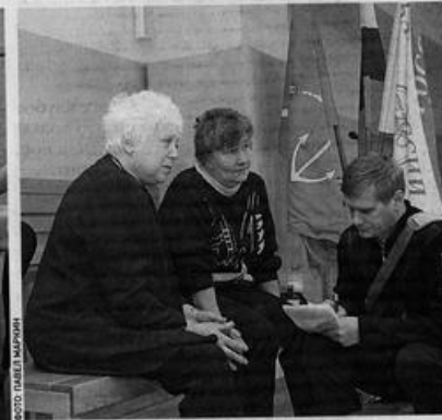
Матери всегда живут надеждой