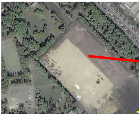
Зона спортивной активности