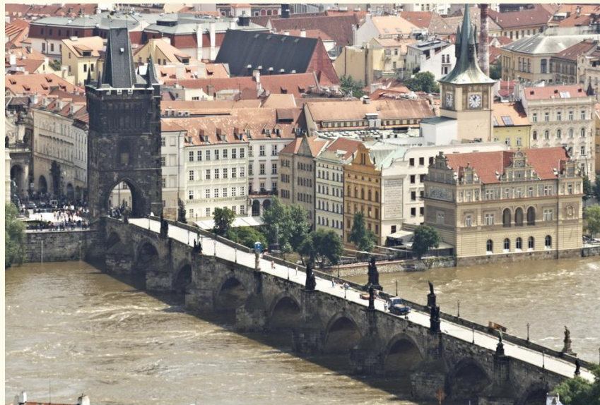
Фото сделано мною еще в июне во время наводнения (вода в реке бурная и грязная)

Дальше наш путь лежал мимо знаменитой пивнушки «У Бегемота», где нам не хватило места, к центральной достопримечательности города Карлову Мосту.