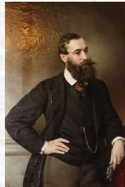
Портрет Б. Н. Чичерина.