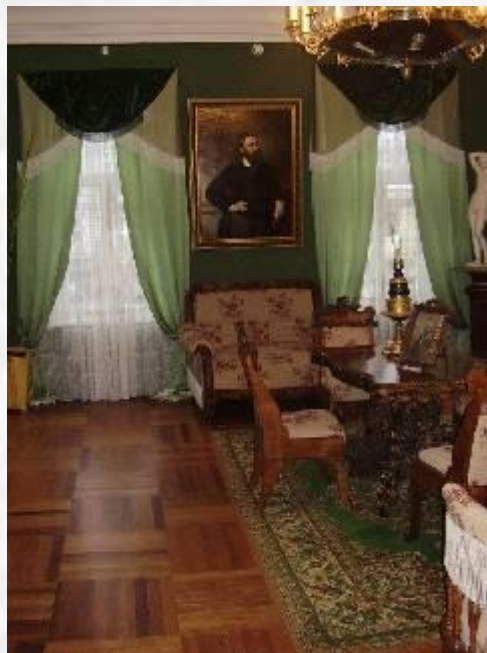
Дом-музей Г. В. Чичерина.

• Дома – музея Г.В. Чичерина , что дядя Георгия Васильевича Борис Николаевич Чичерин был лично знаком с Д.И. Менделеевым, который оценил работу Б.Н. Чичерина, как естествоиспытателя (Б.Н.Чичерин – юрист, но отлично знал математику и выработал свою систему химических элементов, используя математические расчёты);