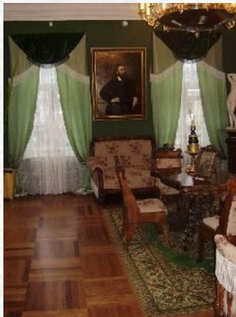
Дом-музей Г. В. Чичерина.

• Дома – музея Г.В. Чичерина , что дядя Георгия Васильевича Борис Николаевич Чичерин был лично знаком с Д.И. Менделеевым, который оценил работу Б.Н. Чичерина, как естествоиспытателя (Б.Н.Чичерин – юрист, но отлично знал математику и выработал свою систему химических элементов, используя математические расчёты);