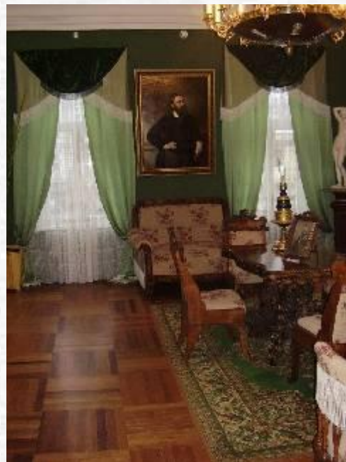
Дом-музей Г. В. Чичерина.

• Дома – музея Г.В. Чичерина , что дядя Георгия Васильевича Борис Николаевич Чичерин был лично знаком с Д.И. Менделеевым, который оценил работу Б.Н. Чичерина, как естествоиспытателя (Б.Н.Чичерин – юрист, но отлично знал математику и выработал свою систему химических элементов, используя математические расчёты);