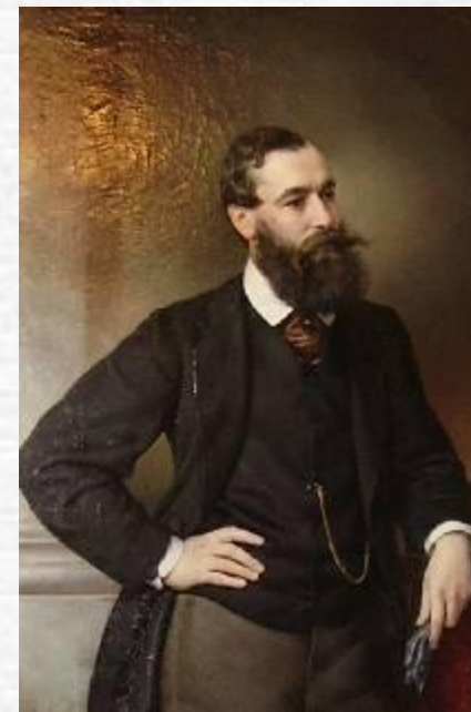
Портрет Б. Н. Чичерина.