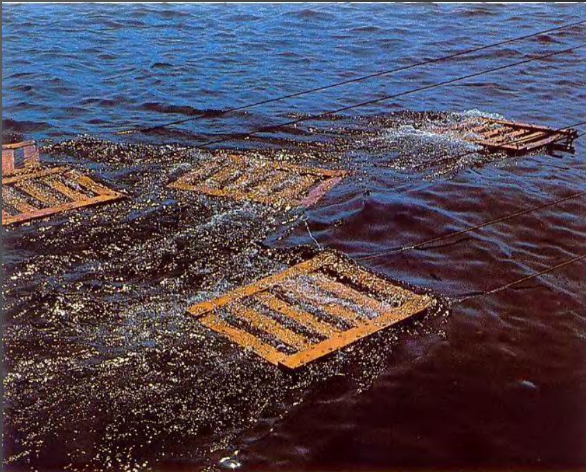
Нефть в водоеме

Поэтому все серьезные случаи загрязнения океана связаны с нефтью. В результате широко распространённой практики мытья трюмов танкеров, в океан ежегодно сознательно сбрасывается от 8 до 20 млн баррелей нефти. Раньше такие нарушения часто оставались безнаказанными, но сегодня спутники позволяют собрать необходимые улики и привлечь виновных к ответственности