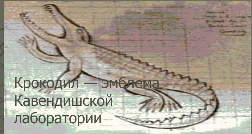
Крокодил — эмблема Кавендишской лаборатории