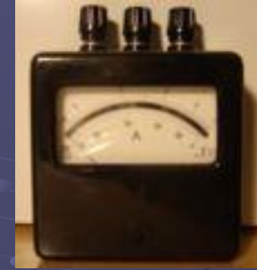
Амперметр переменного тока