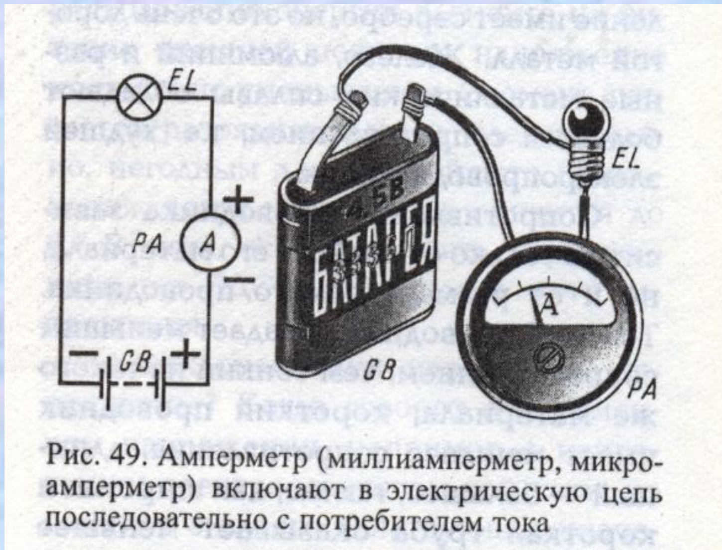
Рис. 49. Амперметр (миллиамперметр, микроамперметр) включают в электрическую цепь последовательно с потребителем тока