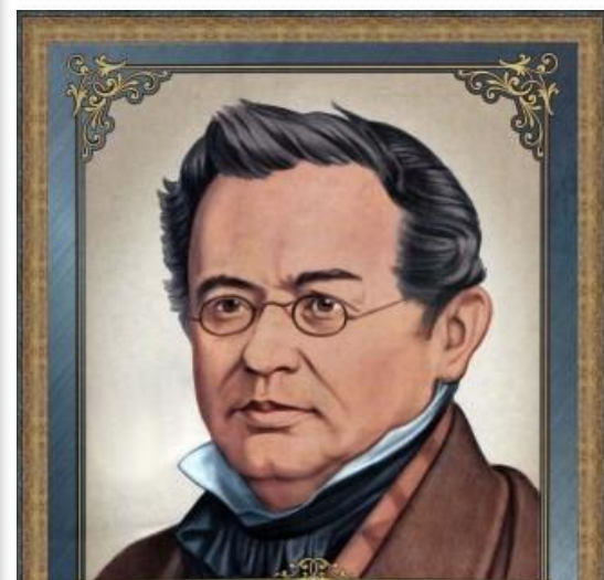
Ленц Еміль (1804 — 1865)

Російський фізик і електротехнік. Академик Петербурзької академії наук. Відкрив закон теплових дії електричного струму. Встановив правило для визначення напрямку індукційного струму. Вивчив явище «реакції» котушки, а для зменшення його дії запропонував використовувати з'єднання двох навієв. Співпрацював над виготовленням фарми крукої змінного струму. Розробив балістичний метод для вимірювання магнітного потоку. Досліджував вертикальний розподіл температури та солоності води в океані. Запропонував метод барометричного навігасування.