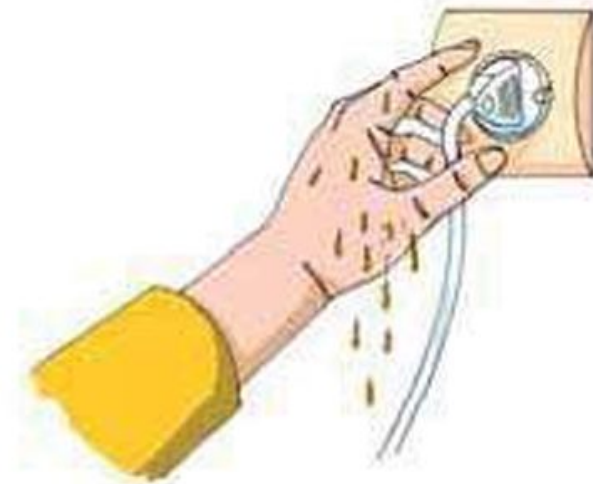
Мал. 193. Неприпустимо вмикати та вимикати шнури живлення вологими руками