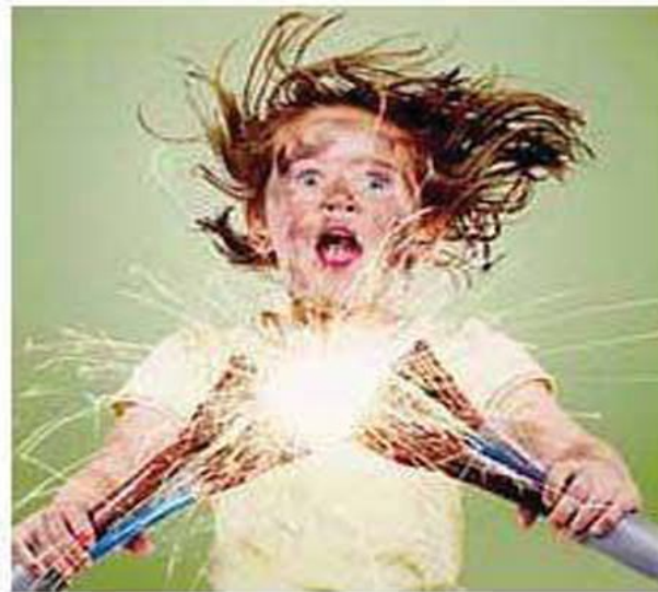
Мал. 189. Можливі наслідки недбалого ставлення до правил безпечного користування електроприладами