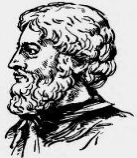
Фалес Милетский — древнегреческий ученый (VI в. до н. э.)