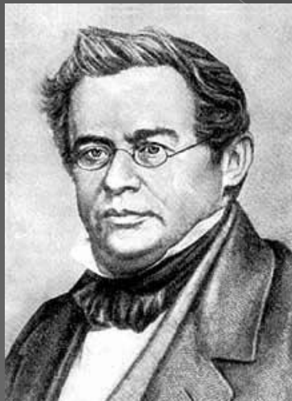
Эмилий Христианович Ленц