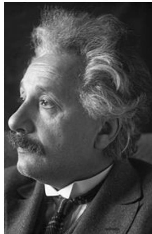
Альберт Эйнштейн (1879 - 1955)