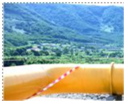
Первый запуск Мутновской ГЭС

Сегодня наша планета стоит на пороге экологической катастрофы и наиболее грозный предвестник ее – парниковый эффект. Он вызван увеличением содержания в атмосфере углекислого газа, который образуется в огромных количествах при сжигании топлива. Того самого топлива, которое используется для обеспечения наших квартир светом, теплом и водой. Значит, судьба нашей планеты зависит от каждого из нас, от всего человечества, а вернее, от того, сколько мы потребляем природных ресурсов и как экономим то, что даёт нам природа!