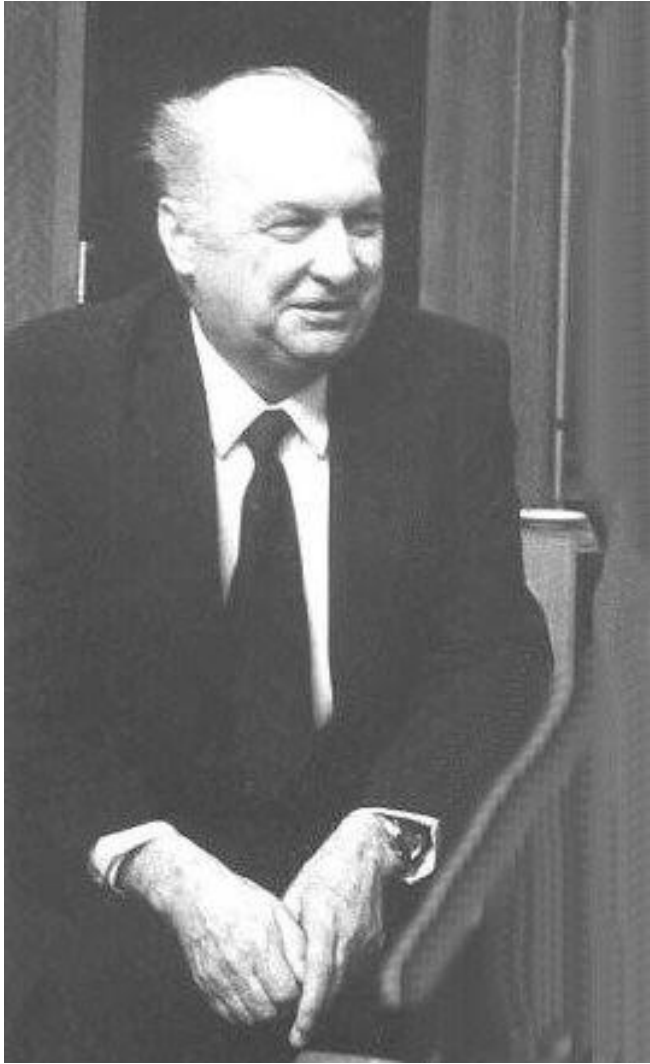
А.М. Балдин (1926-2001)

Подобные реакции при столкновениях релятивистских ядер, полученных в ускорителе, впервые в мире осуществлены в лаборатории высоких энергий Объединённого института ядерных исследований в г. Дубне, под руководством академика Александра Михайловича Балдина. Лишённые электронной оболочки ядра были получены путём ионизации атомов углерода лазерным лучом.